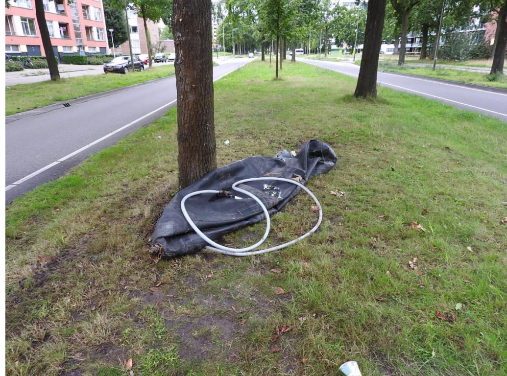
Grote stukken rubber in de middenberm