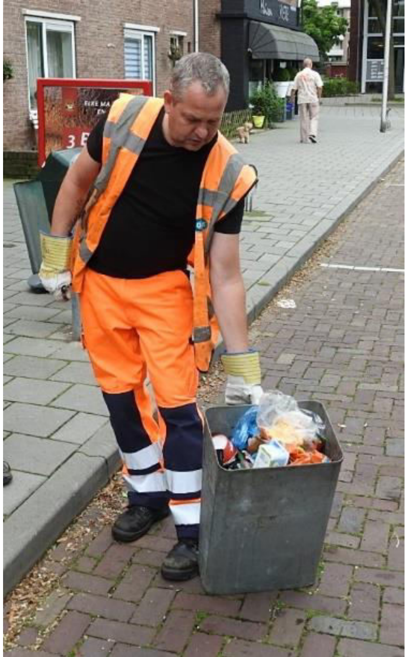
We starten en de eerste bakken zitten vol met huisvuil