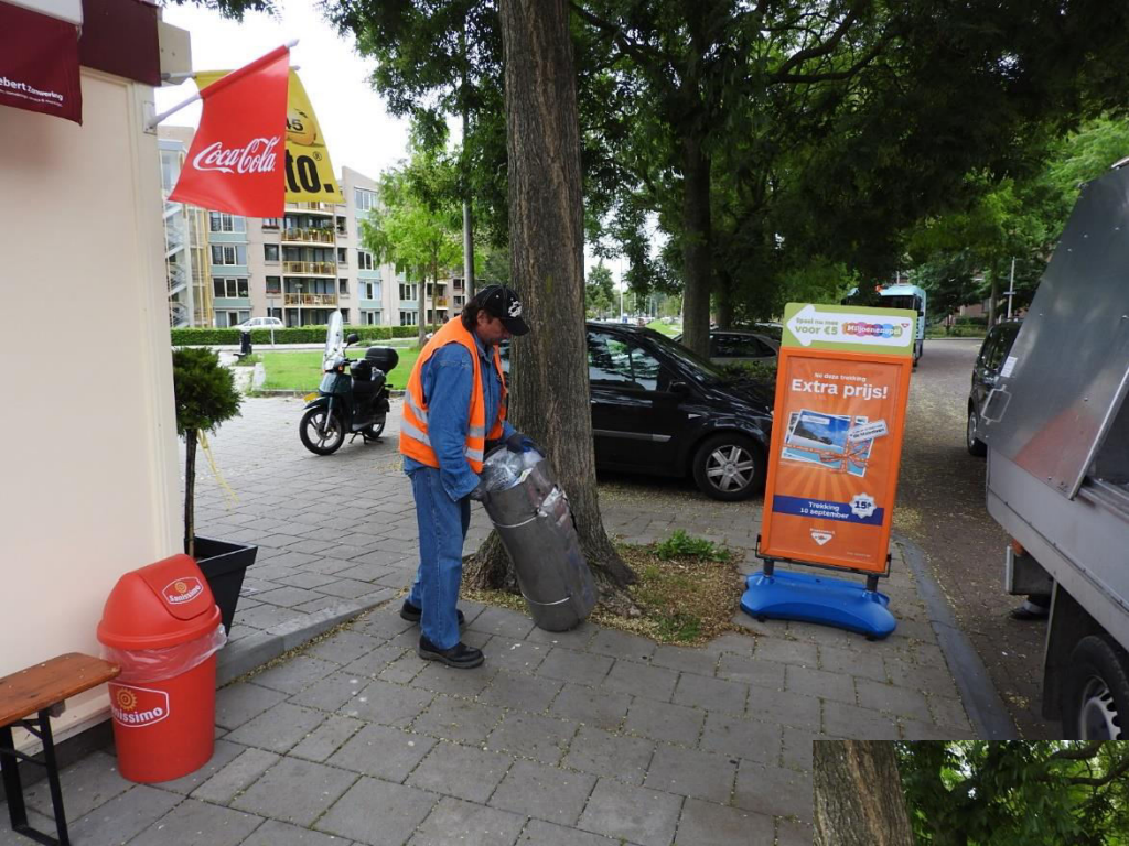
De veel te zware bakken aan het Mariënborgplein